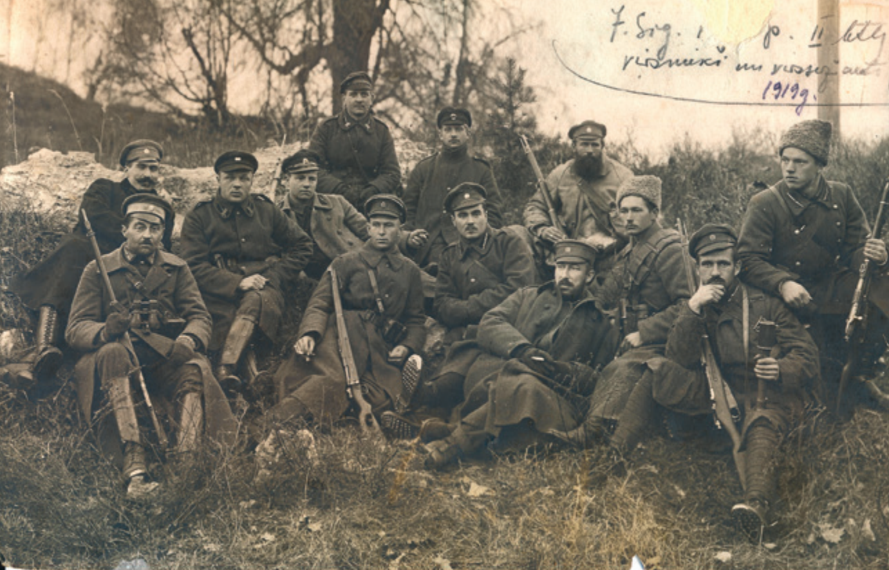
Latvijas armijas 7. Siguldas kājnieku pulka 2. bataljona virsnieki un instruktori 1919. gada rudenī.