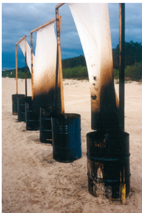
Oļegs Tillbergs. Baltie spārni. 1997. Instalācija. Jūrmala.

Oļegs Tillbergs tiek pieskaitīts pie pirmās konceptuālistu paaudzes, kura ienāca Latvijas mākslas dzīvē 80. gadu beigās un 90. gados aktīvi emancipējās no padomju mākslas vērtībām, nododoties jaunu mediju un formu eksperimentiem. Instalācija kļuva par vienu no dominējošajām mākslas formām, un Oļegs Tillbergs tā valodu pārvalda perfekti. Industriāli un dabas materiāli, jau gatavi objekti un vielas pārtop sociālās, bieži vien gigantiska mēroga metaforās. 1997. gadā Jūrmalā notika starptautisks zinātniski praktisks seminārs “Naftas termināli Austrumbaltijā – vides problēmas”, un tā laikā Tillbergs jūras malā radīja instalāciju “Baltie spārni”. Naftā izmērcēti balti palagi plīvoja virs naftas mucām, abstrakti liekot tajos saskatīt putnus, kas nespēj pacelties spārnos un doties tālāk. Viens no poētiskākajiem un vizuāli efektīvākajiem Tillberga darbiem ne vien apliecina viņa mākslinieciskā atvēziena plašumu (katrai kultūrai nepieciešams savs Jozefs Boiss!), bet arī lielā mērā iemieso Latvijas instalāciju mākslas monumentālās poētikas kvintesenci.