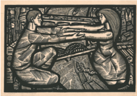
Gunārs Kroļis. Tilti. No cikla "Mana Rīga". 1967. Papīrs, linogriezums. 68 x 103 cm. VMM AL-223. No Latvijas Nacionālā mākslas muzeja kolekcijas.

smejošas, ar visiem iespējamajiem sociālisma labumiem apmierinātas, šķelmīgas strādnieces, taču vienlaikus pilnībā pakļautas vīrieša skatienam, uz kuru gleznas varones reaģē ar flirta situācijai atbilstošu ķermeņa valodu. Korņeckas darbs atgādina par tendenci no nacionālā kanona izstumt gan nelatviešu tautības māksliniekus, gan pašu sociālistisko reālismu – Korņeckas darbā jau parādās skarbā stila ietekmes, taču vēl dominē mīti par saules apspīdētajiem darbaļaudīm, kuru sociālo statusu izceļ neskanīgi parupjais darba nosaukums.