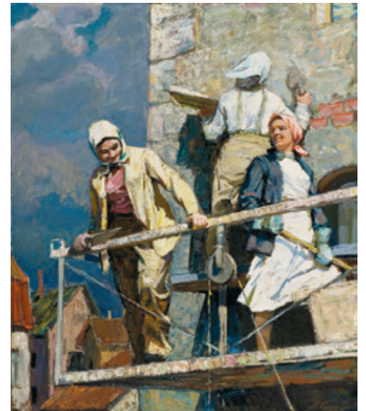
Mihails Korņeckis. Saturieties, meitenes! 1959. Audekls, eļļa. 190 x 160,7 cm. VMM AG-2220. No Latvijas Nacionālā mākslas muzeja kolekcijas.

Mākslas darbs, ar kuru gribētu raksturot padomju režīma mākslas pirmo posmu, latviešu valodā sastopamajos informācijas avotos dēvēts par “A nu ka meitenes!”, savukārt krievu valodā sacerēta teksta tulkojumā nodēvēts par “Saturieties, meitenes!”. Arī par pašu gleznas autoru Mihailu Korņecku latviešu valodā atrodama vien fragmentāra informācija. Viņš ir dzimis un uzaudzis Maskavā, jauktā ģimenē, 1950. gadā, 24 gadu vecumā ieradies pie mātes Rīgā, uzsācis studijas Latvijas Mākslas akadēmijā un turpmāko dzīvi pavadījis šeit. Gleznas “A nu ka meitenes!” nosaukums un pati kompozīcija netieši norāda uz divējādo sievietes stāvokli padomju režīma sabiedrībā. Oficiālajā ideoloģijā tiek sludināta pilnīga līdztiesība, taču realitātē sievieti ierobežo dubults morālais un pienākumu slogs, kas uz ilgāku laiku ir izkropļojis šejienes priekšstatus par dzimumu līdztiesību. Šo pretrunu nejausi iezīmē arī Korņeckas darbs. Tajā redzamas