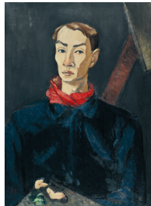
Jēkabs Kazaks. Pašportrets ar sarkano kaklautu (Pašportrets ar paleti). 1918. Audeklis, eļļa. 80 x 58 cm. VMM GL-468. No Latvijas Nacionālā mākslas muzeja kolekcijas.

Jēkabs Kazaks Latvijas valsts simtgades hronoloģijā iekļaujas pavisam īsu laika sprīdi, tikai divus gadus. Viņa pārgrā aiziešana no dzīves 1920. gadā un novatoriski izcilais māksliniecisks talants ir ļoti romantizējis Kazaka tēlu Latvijas kultūras apziņā, daudzu iztēlē raisot asociācijas ar liktenīgas izredzētības misiju. Līdzīgas sajūtas raisa arī Latvijas 80. gadu beigu māksla, liekot domāt par kādu savdabīgu korelāciju starp laikmeta sarežģītību un māksliniecisks enerģijas jaudu. Viņa "Pašportrets ar sarkano kaklautu" gleznots 1918. gadā, laikā, kad vēl pavisam trauksmainos apstākļos notika Latvijas valsts pašnoteikšanās cīņas. Laikmeta un personības traģisms gleznā atklājas vienlīdz spēcīgi, gluži tāpat kā paša Kazaka personības ģeniālais trauslums un spēks. Jēkaba Kazaka mākslas valoda atspoguļo sava laika aktuālos modernisma strāvumus, taču vienlaikus viņa gleznoto tēlu skatieni, žesti, kustības iemieso kaut ko ārpus laika un šīs pasaules esošu, vēl vairāk mistificējot Kazaka īpašo nozīmi lokālajā mākslas vēsturē.