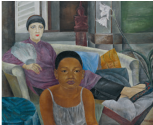
Aleksandra Beļcova. Baltā un melnā. 1925. Audekls, eļļa. 100 x 120 cm. VMM GL-4818. No Latvijas Nacionālā mākslas muzeja kolekcijas.