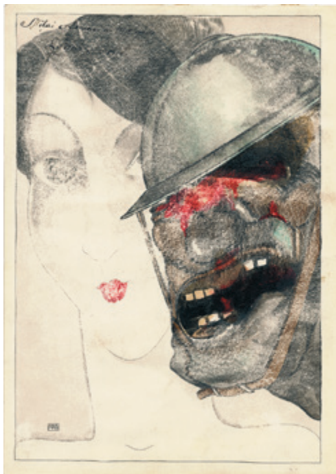
Kārlis Padegs. Mīļai atmiņai no 1918. gada. Džons Iperits. 1935. Papīrs, tuša, akvarelis. 34,3 x 24,5 cm. VMM Z-6654. No Latvijas Nacionālā mākslas muzeja kolekcijas.

Kārlis Padegs ir mākslinieks, kurš patik ikvienam. Gluži kā seriāls “Tvinpika” vai ceļojumi uz tālām zemēm. Savdabīgi, ka viņa daiļradē nav gandrīz neviena darba, kas liktos neizdevies vai neveiksmīgs, un fascinē arī ļoti līdzīgu motīvu variācijas, atkārtojumi. Padega īpašo lomu kultūras vēsturē pastiprinājis Latvijas mākslā neierastais dendija tēls, kas caurstrāvo ne vien viņa