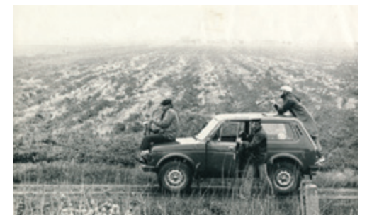
NSRD ("Nebijušu sajūtu restaurēšanas darbnīca"). Gājiens uz Bolderāju. 1987. Performance.