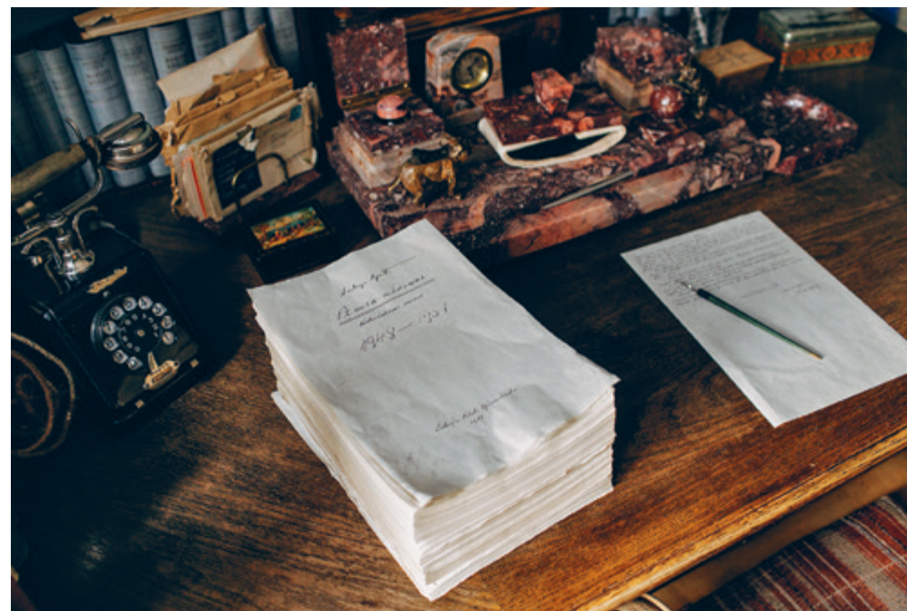
Andreja Upīša memoriālais dzīvoklis Rīgā, Brīvības ielā

jo negantāks kļuva pārējo aizvainojums. Visur cauri vijās galvenais jautājums: KĀPĒC NEIELŪDZA MANI? Pēc vairāk nekā pusgada aizgāju līdz draudzenei uz semināru ar nosaukumu “Atskats uz Latvijas simtgades svinībām. Veiksmes stāsts”. Viņa mani pierunāja, sakot, ka pēc tam gaidāms labs bankets – vīns, lasis, kanapē un nēģi, viss tur būšot. Kā pie latviešiem! “Par vienu no simtgades spilgtākajiem pasākumiem izvērsās Andreja Upīša svinības rokkafejnīcā, par ko milzu paldies jāsaka Teterevu fondam...” stāstu iesāka sieviete no Latvijas simtgades biroja, un visi viņai vētraini aplaudēja.