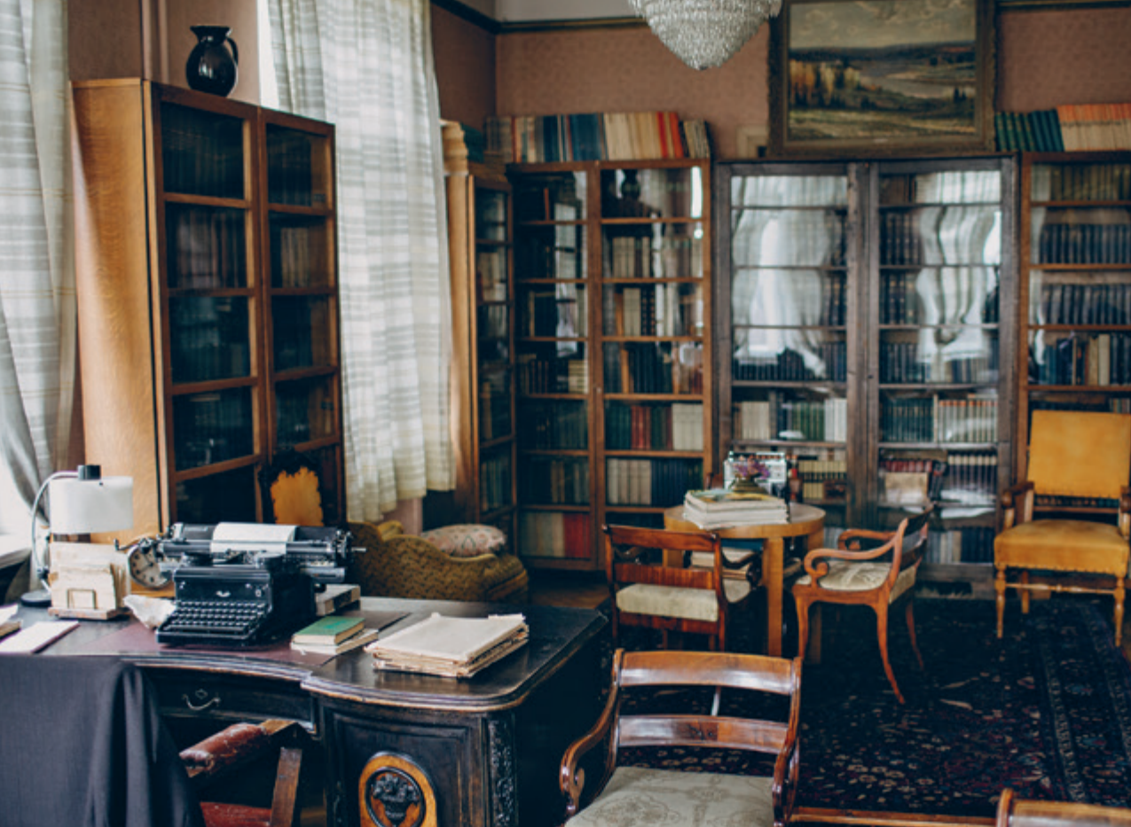
Andreja Upīša memoriālais dzīvoklis Rīgā. Brīvības iela