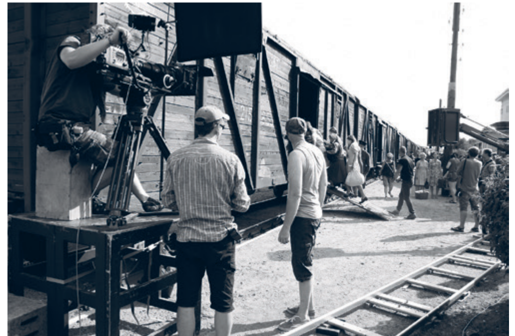
Skats no filmas “Melnā kronika” filmēšanas laukumā