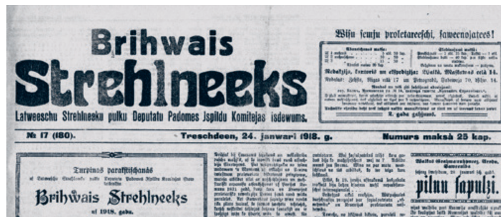
Laikraksts “Brīvais Strēlnieks”, 1918. gada 13. janvārī

referātiem par mākslas uzdevumiem jaunajā laikā un aktuāliem politiskiem procesiem, nosaka kreisi noskaņoti politiķi un kultūras dzīves organizatori. Bet “jaunais laiks” traktēts ne tikai kā kara, bet arī (un galvenokārt) kā Krievijas 1917. gada pēcrevolūcijas laiks, kad jātop jaunai sabiedrībai, jauniem tukumiem un jaunam cilvēkam. Tiešā saskaņā ar boļševiku lozungiem par hegemonu, kas šo procesu veiks, tiek izvirzīts proletariāts, citiem vārdiem, strādniecība. Tāpēc arī “Liesmu” nodēvē par strādnieku teātri, tam piešķirot vēstures arēnā uznākušās jaunās varas šķiras vārdu. Strādnieku teātris netiek izprasts kā teātris, kurā spēlē strādnieki vai kurš rāda tikai strādniekiem, bet kā teātris, kura darbu nosaka proletariāta ideoloģija, izpratne par sabiedrības attīstību un kultūras, tostarp teātra, lomu tajā. Pirmā pasaules kara gados latviešu aktieri un režisori darbojas ne tikai Valkas, bet arī vairākos citos strādnieku teātros Krievijas teritorijā, piemēram, Maskavas Latviešu strādnieku teātrī, Pēterpils Latviešu strādnieku teātrī, Harkovas Latviešu strādnieku teātrī. Bet 1919. gada 23. februārī Rīgā Pētera Stučkas valdības laikā ar Andreja Upīša teorētisko un organizatorisko atbalstu (viņš ir Izglītības komisariāta Mākslas nodaļas vadītājs) tiek proklamēts Padomju Latvijas Strādnieku