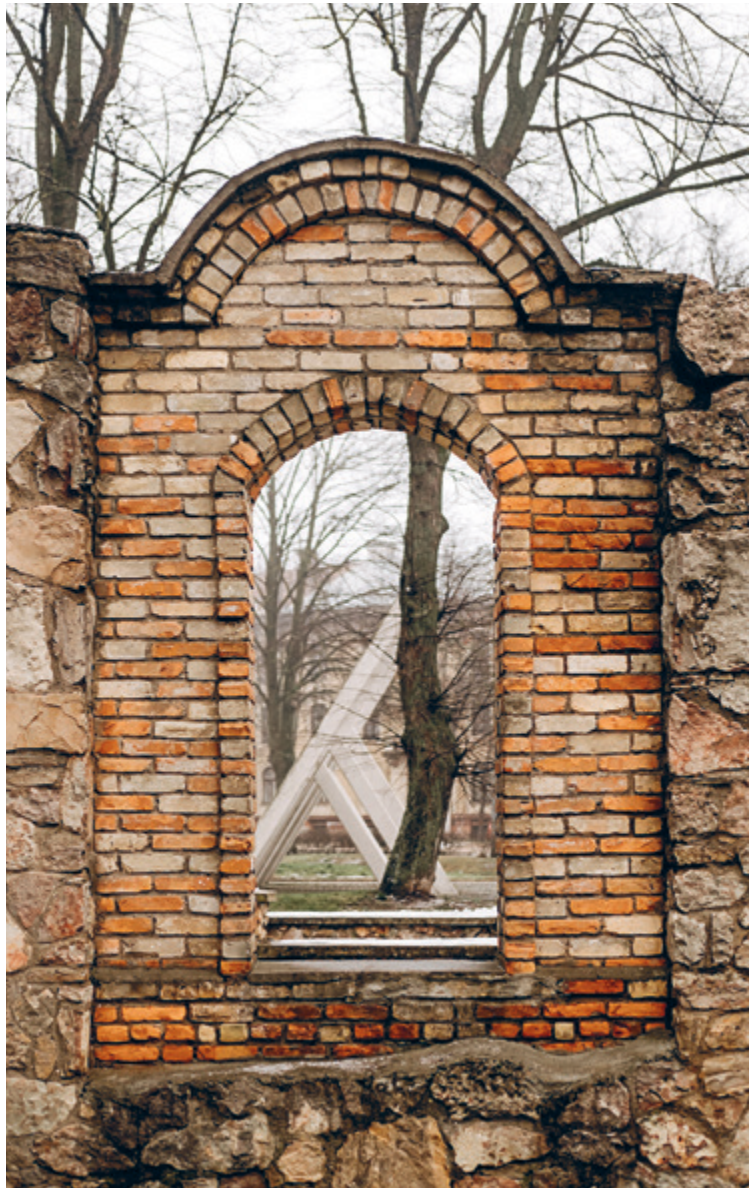
Rīgas Horālās sinagogas drupas Gogoļa un Dzirnau ielas krustojumā